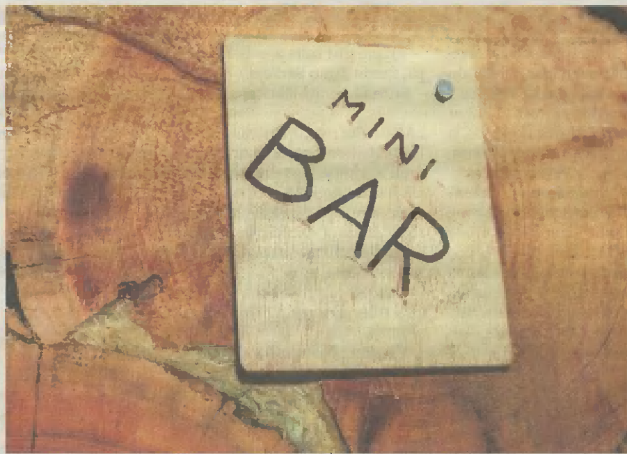
HOTELLIHUONEEN minibaarin luukun takaa löytyy Koskenkorva-pullo.