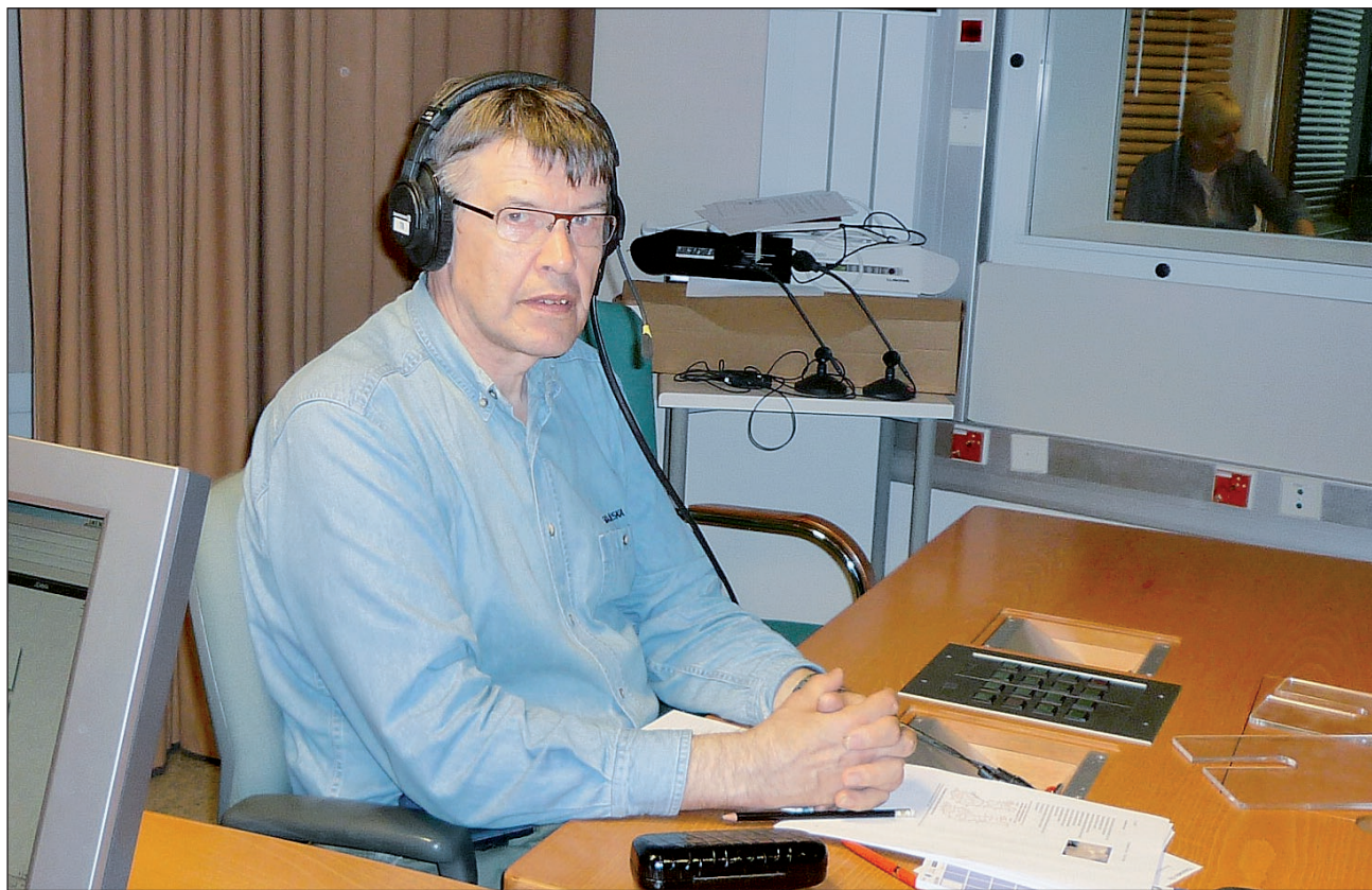
Meteorologi Asko Hutila vastaamassa Radio Suomen Sääillassa kuuntelijoiden kiperiin kysymyksiin.