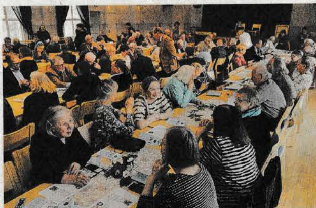
Vilkasta puheensorinaa ja muistoja menneiltä vuosilta, niitä riitti lämminhenkisessä juhlassa.